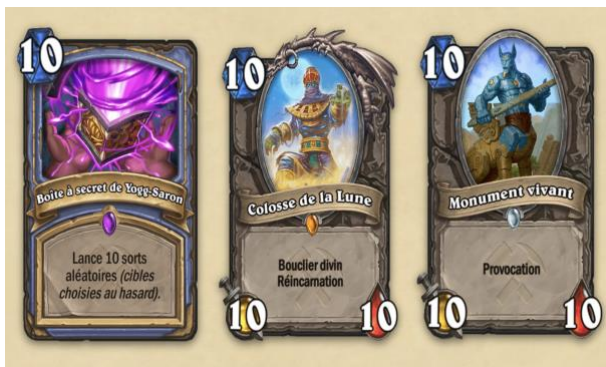
Screenshot 4: HearthStone – Extension 2019 « Die Abenteuer von Uldum » (Blizzard Entertainment)

Beispiel: Eine weitere Strategie, um Verbraucher zu integrierten Käufen zu ermutigen, ist die "Pay or Wait"-Methode. Nach Labelle und Boucher [17, S. 81] geht es dabei um eine überbewertete Bewertung der Zeit. Das Prinzip ist einfach: Nach einem Misserfolg muss der Verbraucher eine gewisse Zeit warten, bevor er es erneut versuchen kann, es sei denn, er zahlt für die Gelegenheit, es erneut zu versuchen.