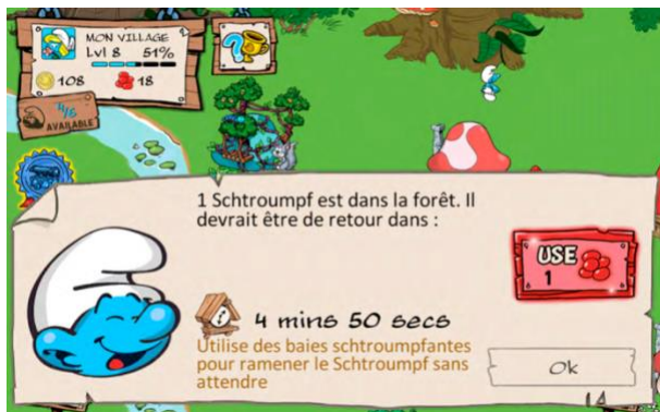
Screenshot 3: The Smurfs (IPMS)

Beispiel: Clash of Clans ist ein Massively Multiplayer Online Real-Time Strategy Game (MMO). Bei solchen Spielen üben die von den Teammitgliedern getätigten Investitionen Druck auf Sie aus, mehr auszugeben, um ihre Investitionen zu erreichen oder zu übertreffen.