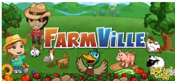
Screenshot 1: FarmVille (Zynga)

Beispiel: FarmVille, einer der grössten Erfolge dieser so genannten sozialen Spiele, ist ein typisches Beispiel für ein Monetarisierungsmodell, das auf sozialen Interaktionen basiert. In diesem Spiel [16] kann man durch den Kontakt mit anderen Spielern seinen Betrieb schneller verbessern, indem man ihre Hilfe als Landarbeiter nutzt oder durch ihre Hilfe Belohnungen verdient. In Ermangelung solcher