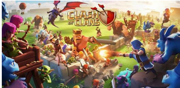
Screenshot 2: Clash of Clans Banner (Supercell)

Kontakte kann der Spieler natürlich auch eine Kreditkarte nehmen und eine Mikrotransaktion durchführen.